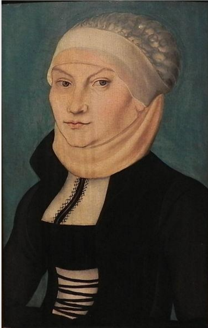
Kateřina von Bora